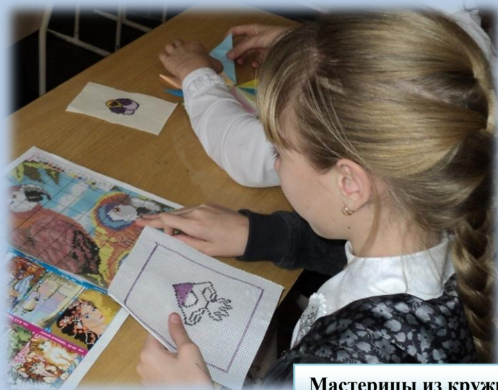
Мастерицы из кружка «Азбука мастерства»