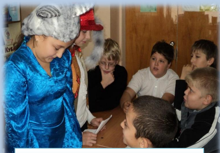
Заседание клуба «Что? Где? Когда?»